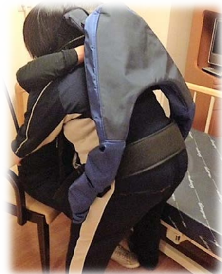
中腰で腰への負担のかかる車イスからベッドへの移乗介助時に使用している。

「効果があることは実感できている。こういった業務で利用するかを明確化し、その運用マニュアルを作っていくことが直近の課題です。効果を明示するためにもアンケート等でデータを取ることを継続していきたい。装着方法の標準化はマッスルスーツ®のメーカーであるイノフィスからのサポートも期待しています(主任PT押野氏)」。