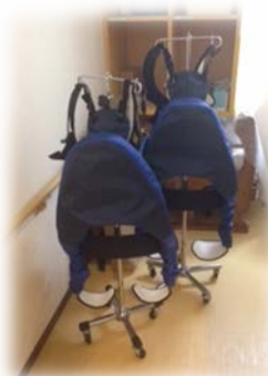
マッスルスーツ®は、専用の台で管理している。